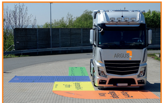
LKW mit ARGUS Safety Folie „Mobil“

Die ARGUS Safety Folie hilft das Unfall-Risiko beim Rangieren und Abbiegen um bis zu 40 % zu senken.